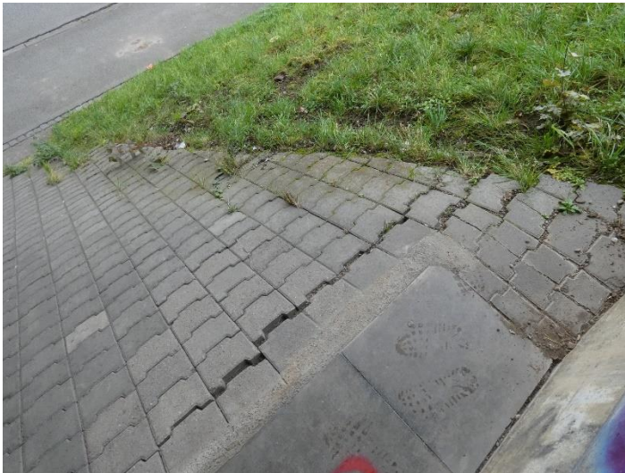
Böschungspflasterung leicht deformiert