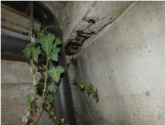
Abplatzungen und freiliegende / korrodierte Bewehrung beim Endquerträger