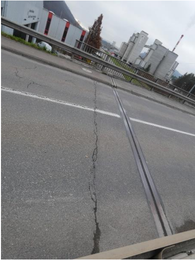
Querriss über gesamte Strassenlänge beim Übergang Brücke - Vorlandbereich