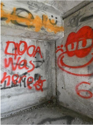
freiliegende / korrodierte Bewehrung beim Widerlager