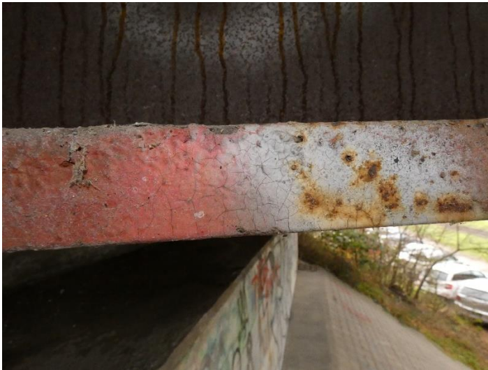
Oberflächenschutz beschädigt / abgenutzt