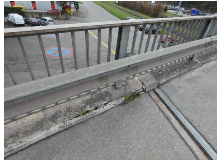
Abplatzungen und Risse beim Übergang vom Konsolkopf zum Gehweg