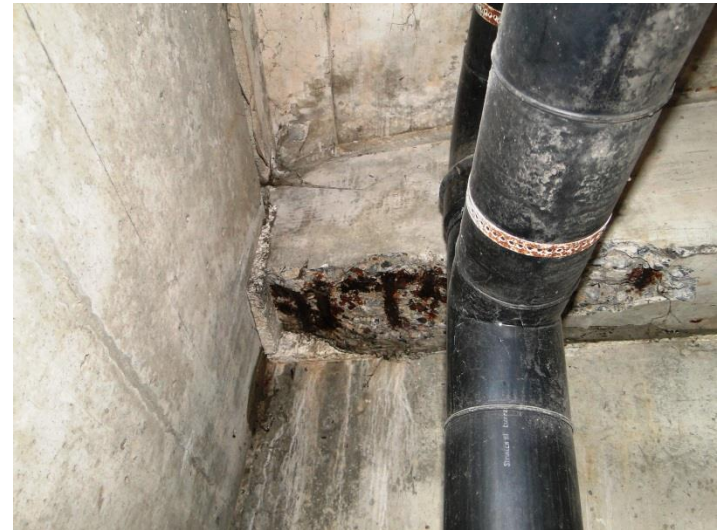
1 (179) - Kopie