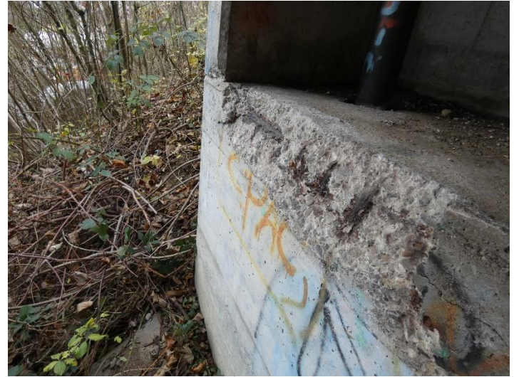
Abplatzungen und freiliegende / korrodierte Bewehrung beim Widerlager