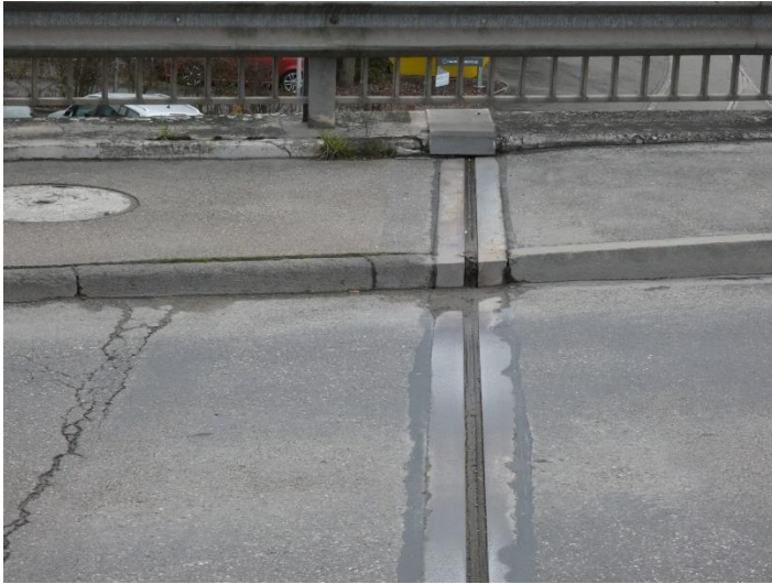
Sichtbare Verschmutzung / Ablagerung beim Tiefpunkt des Fahrbahnüberganges, Fahrbahnübergang stark abgenutzt, Risse im Belag