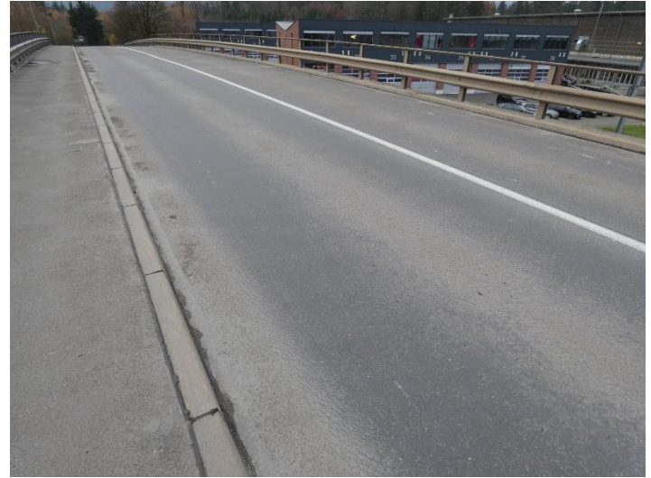
Fahrbahnbelag stark abgenutzt, starke Spurrinnen, starkes «Schwitzen» des Belags (Bindemittel tritt an Oberfläche)