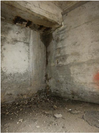
freiliegende / korrodierte Bewehrung inkl. Nassstellen in WL-Ecke