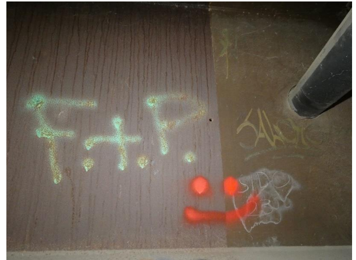
Oberflächenschutz des Blechträgers beschädigt / leicht Korrosionsspuren erkennbar