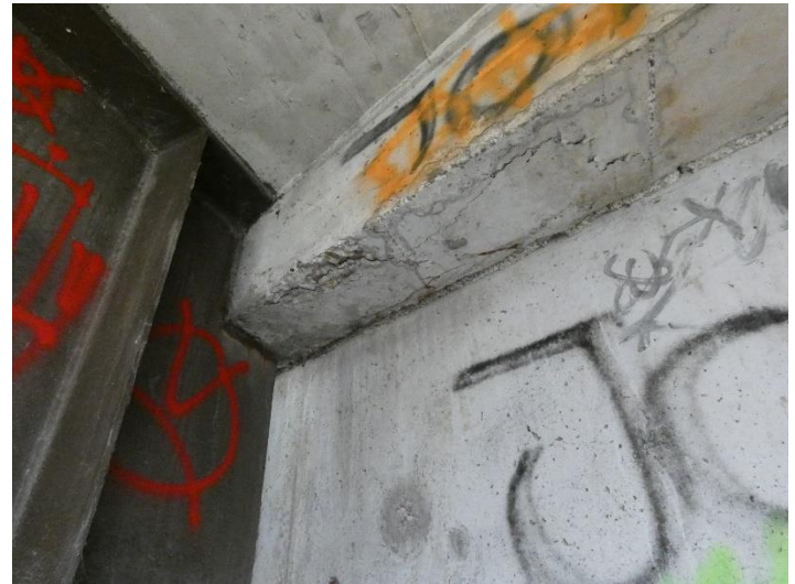
Risse und leicht Abplatzungen beim Endquerträger