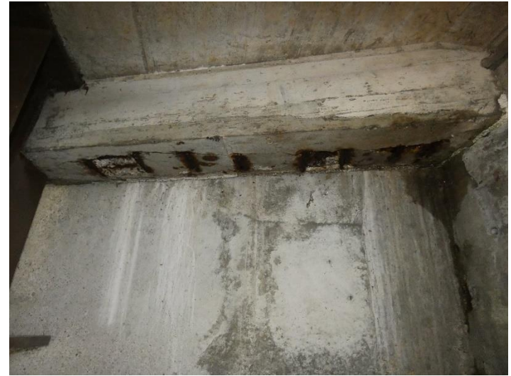
flächig freiliegende und korrodierte Bewehrung beim Endquerträger