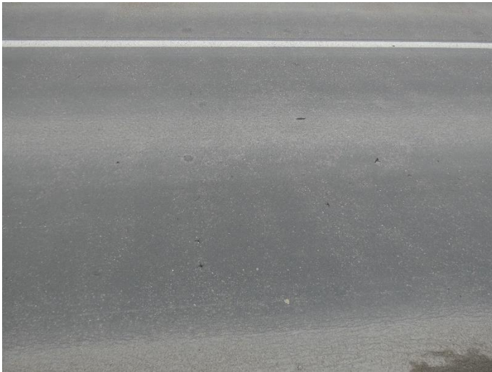
Anzeichen von Abplatzungen im Belag